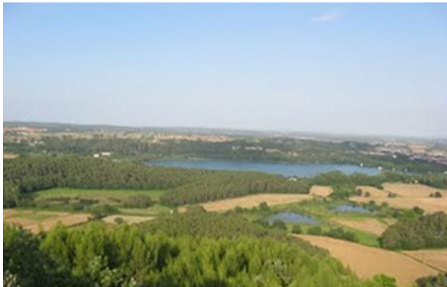
Vista de l'estany des del Puig Clarà

Baixarem pel mateix camí i arribarem a Can Morgat, enfilat al turó, ens recorda la llegenda que dóna una explicació tradicional de l'origen de l'estany ('Morgat! Morgat! vés-te'n a casa o seràs negat!'). A la riera del mateix nom, que porta aigua tot l'any gràcies a unes surgències subterrànies, s'hi han refugiat els últims peixos autòctons de la zona lacustre: el barb de muntanya i també passarem per la llacuna de Can Morgat, un bon exemple de recuperació de zones humides, que antigament eren dessecades per incrementar la superfície agrícola i actualment permeten millorar el paisatge i augmentar la biodiversitat de l'entorn de l'estany. Des d'aquí ens arribarem a l'estany de Banyoles. Seguirem al camí que fa la volta a l'estany fins arribar al Parc de la Draga a on dinarem. Després de dinar alguns pares hauran d'anar a buscar el cotxe al lloc on l'hauré deixat a l'inici de la sortida.